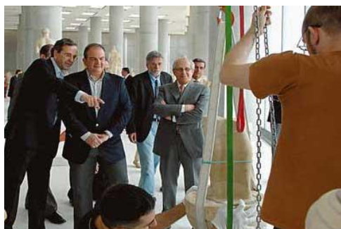
Premier Karamanlis mit Kulturminister Samaras und Professor Pantermalis

Bei seinem Besuch im neuen Museum im Mai, sprach Premierminister Karamanlis von einem „Schmuckstück, einem hochmodernen Bildungs- und Kulturzentrum“. „Das neue Museum widerspiegelt das Niveau der griechischen Geschichte und Kultur und verstärke die Argumente Griechenlands für die Wiederherstellung der Einheit des Parthenonfrieses“, betonte vor einem Jahr der Staatspräsident, Karolos Papoulias , bei seinem Besuch im neuen Museum. Auf die „globale Botschaft“ der Akropolis hat der Staatspräsident neulich während einer Tagung in Helsinki über die Parthenonskulpturen und das Neue Museum verwiesen; zugleich hat er sich zuversichtlich gezeigt, dass der Parthenonfries bald seine Stelle im neuen Museum finden werde. Auf derselben Tagung hat Dimitris Pantermalis, Präsident der Gesellschaft zur Errichtung des Neuen Akropolis-Museums , noch mal bekräftigt, dass Repliken der originalen Parthenonskulpturen im British Museum beherbergt werden könnten, wenn diese im Akropolis-Museum ausgestellt würden. Finnland ist unter den 17 Ländern, die sich der Internationalen Gesellschaft für die Wiederherstellung der Einheit der Parthenonskulpturen angeschlossen haben. Selbst der Schweizer Architekt des Museums, Bernard Tschumi, hat neulich in einem Interview mit Bloomberg.com zur Rückgabe des Parthenonfrieses aufgerufen. Nicht zuletzt befinden sich 56 der 96 Platten des Parthenonfrieses noch im British Museum.